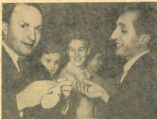
Угадайте, что я выиграл по лотерейному билету?

ва критикует реализм в зрительном зале, а после шести впервые появляется в Третьяковской галерее. На следующий день он авторитетно заявляет корреспонденту «За строительные кадры»: «Да, Федотов действительно неплохой пейзажист».