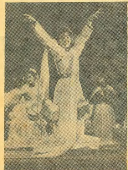
Ансамбль китайских девушек.

В залах клуба МВД собрались не только мисийцы, но и наши гости