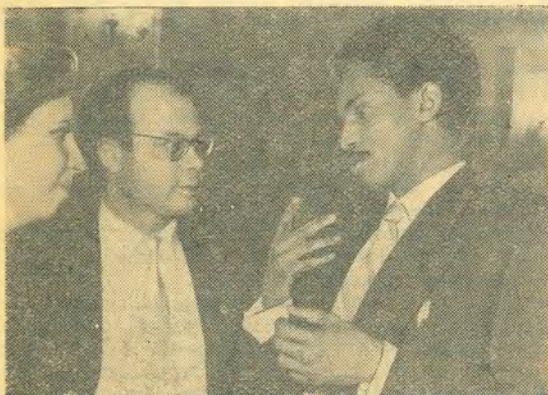
Киприот и представитель знойной Африки.

Каждый год весной в нашем институте проводятся традиционные вечера дружбы со студентами, приехавшими к нам учиться из разных стран. Но вечер этого года отличается от предыдущих тем, что он как бы вышел за пределы институтского масштаба.